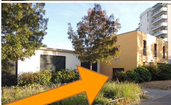
entrée par la porte vitrée sur le côté du bâtiment jaune